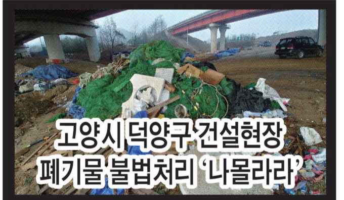
고양시덕양구 건설현장 폐기물 불법처리 '나몰라라'