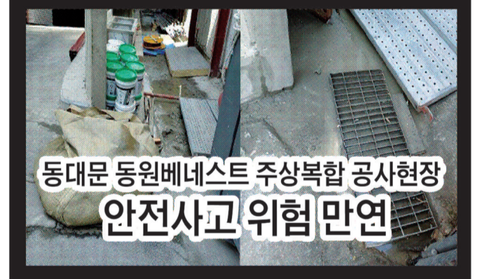
동대문 동원베네스트 주상복합 공사현장 안전사고 위험 만연

농어촌공사, 사회적 경제기업 제품구매... 금요장터 열어 농식품부, 판로 잃은 친환경농가 돕는 '착한 소비' 적극 지원 농림축산식품부, 농번기 일손부족 지원... 농협 인력증개센터 확대