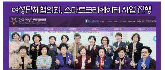
여성단체협의회, 스마트크리에이터 사업 진행

농어촌공사, 사회적 경제기업 제품구매... 금요장터 열어 농식품부, 판로 잃은 친환경농가 돕는 '착한 소비' 적극 지원 농림축산식품부, 농번기 일손부족 지원... 농협 인력증개센터 확대